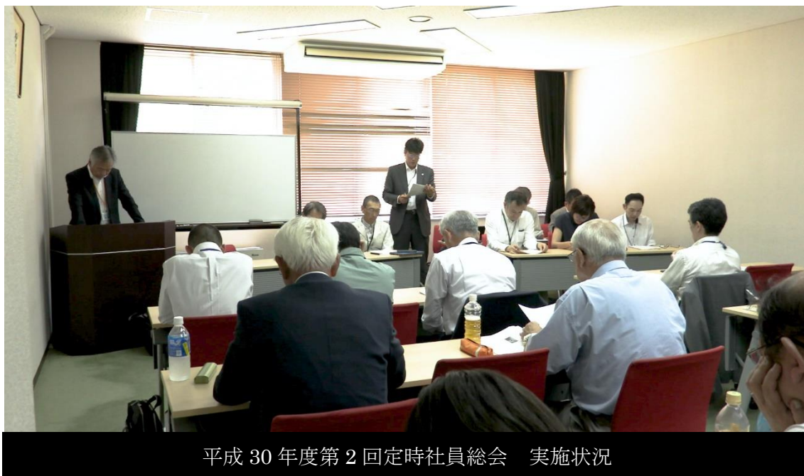
平成30年度第2回定時社員総会 実施状況