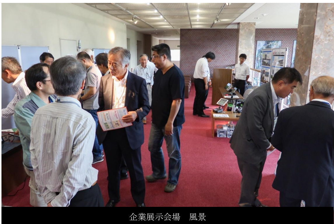
企業展示会場 風景